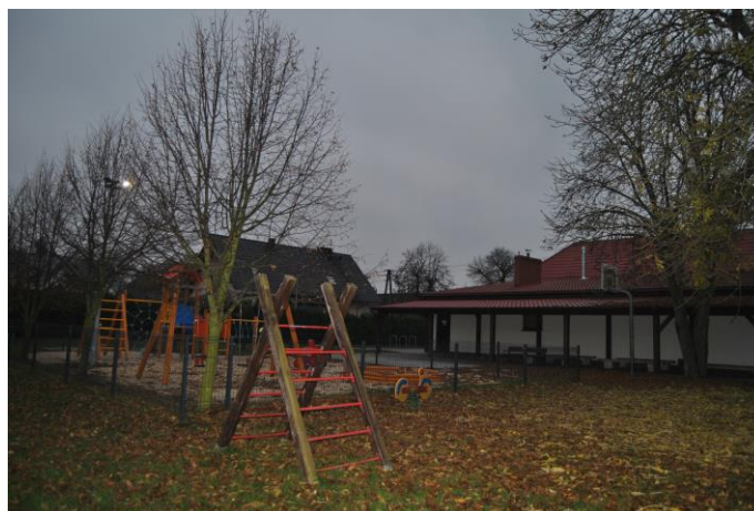
Teren rekreacyjny za świetlicą